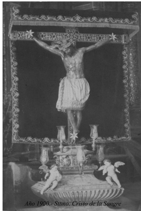
Año 1900.- Stmo. Cristo de la Sangre